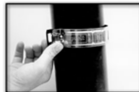
Installation of the stirrup