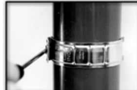
Tightening of the collar by 2/2 turn