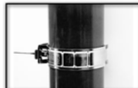
Tightening of the collar by 1/2 turn